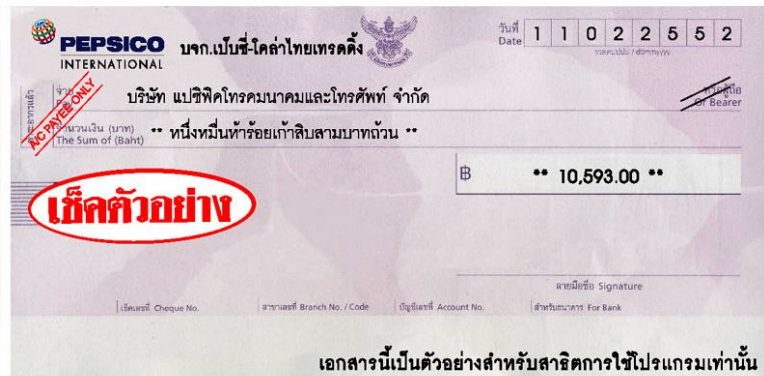
เอกสารนี้เป็นตัวอย่างสำหรับสาธิตการใช้โปรแกรมเท่านั้น